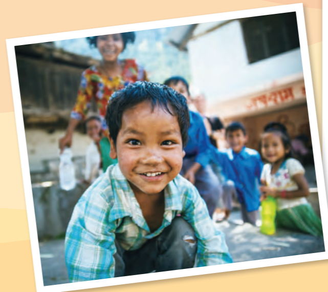
學校針對學生撿來的回收塑膠設計各式課程，讓孩子從中學習環保和專業知識。