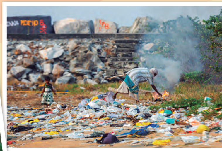
尚未分類的垃圾中，有大量的塑膠垃圾，一經焚燒會釋放有害氣體，污染空氣也危害居民健康。

此外，學校量身訂做各種課程，把基礎學科和技術訓練整合在一起。例如，資源回收搭配生態學、木工搭配數學、刺繡搭配經濟學等。當學生一邊改造塑膠垃圾、製作環保建材，也一邊學到專業知識，眼界更寬闊。