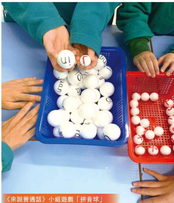
《來說普通話》小組遊戲「拼音球」