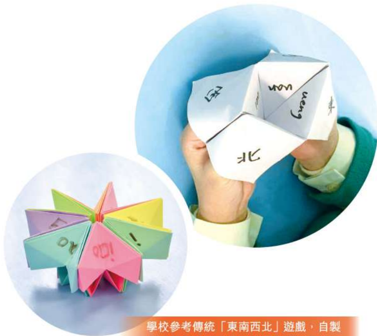
學校參考傳統「東南西北」遊戲，自製遊戲道具，提升學生拼讀音節的趣味。

學校也會 自製遊戲道具 ，例如參考傳統「東南西北」遊戲，加入普通話拼音元素，讓學生邊玩遊戲邊溫習聲韻母，增加練習普通話的機會。相比單純的課本朗讀，把朗讀融入動手操作的活動中，使練習變得有趣好玩。