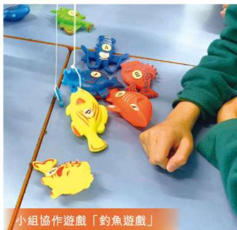
小組協作遊戲「釣魚遊戲」

為了增加課堂的趣味，周老師也會於普通話課和學生進行各類型的小組遊戲，寓學習於娛樂。 《來說普通話》 課本和教材有多樣化的小組協作活動，如「 順風耳 」、「 拼音球 」、「 釣魚遊戲 」等，趣味及學習性兼備。周老師會讓學生分四組，輪流玩不同的遊戲，提升課堂氣氛。