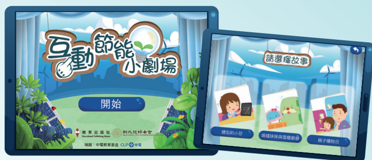
《互動節能小劇場》提供三個與節能生活有關的小故事。

為啟發學生思考，三個小故事의結尾均設有思考問題部分——「 節能想一想 」。老師鼓勵學生們分享他們對故事內容的想法，帶領他們反思日常生活中的用電習慣，學習從小處做起，節能減碳，保護地球。