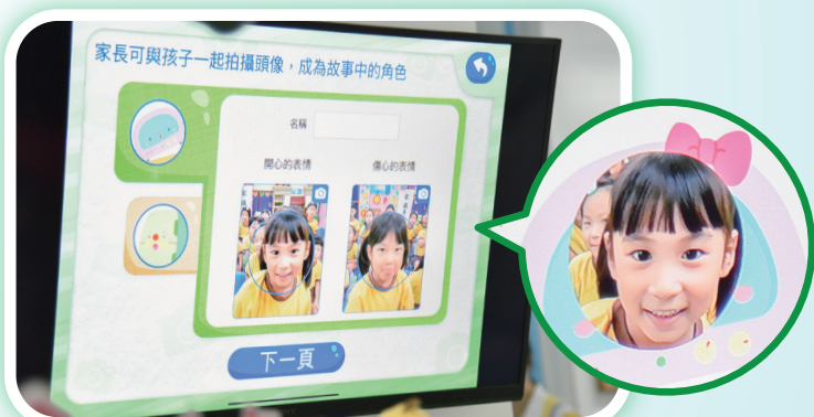
學生可拍攝表情頭像及創作角色名稱，代入成為故事中的主角。

過程中，學生表現得非常投入積極，更會與同學討論故事內容。當遇到新的字詞和句子時，他們會主動地發問。學生不但從故事中學會節能知識，也認識到更多字詞，從而增加詞彙量。