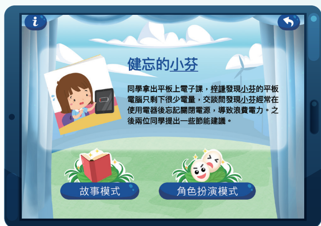
每個小故事都有「故事模式」和「角色扮演模式」。

來到課堂的重點部分，學生需要透過《互動節能小劇場》應用程式的故事和角色扮演活動來學習如何在日常生活中減少用電。在老師的安排下，每兩位學生分為一組，並在老師及家長的協助下利用平板電腦進行應用程式裏的活動。